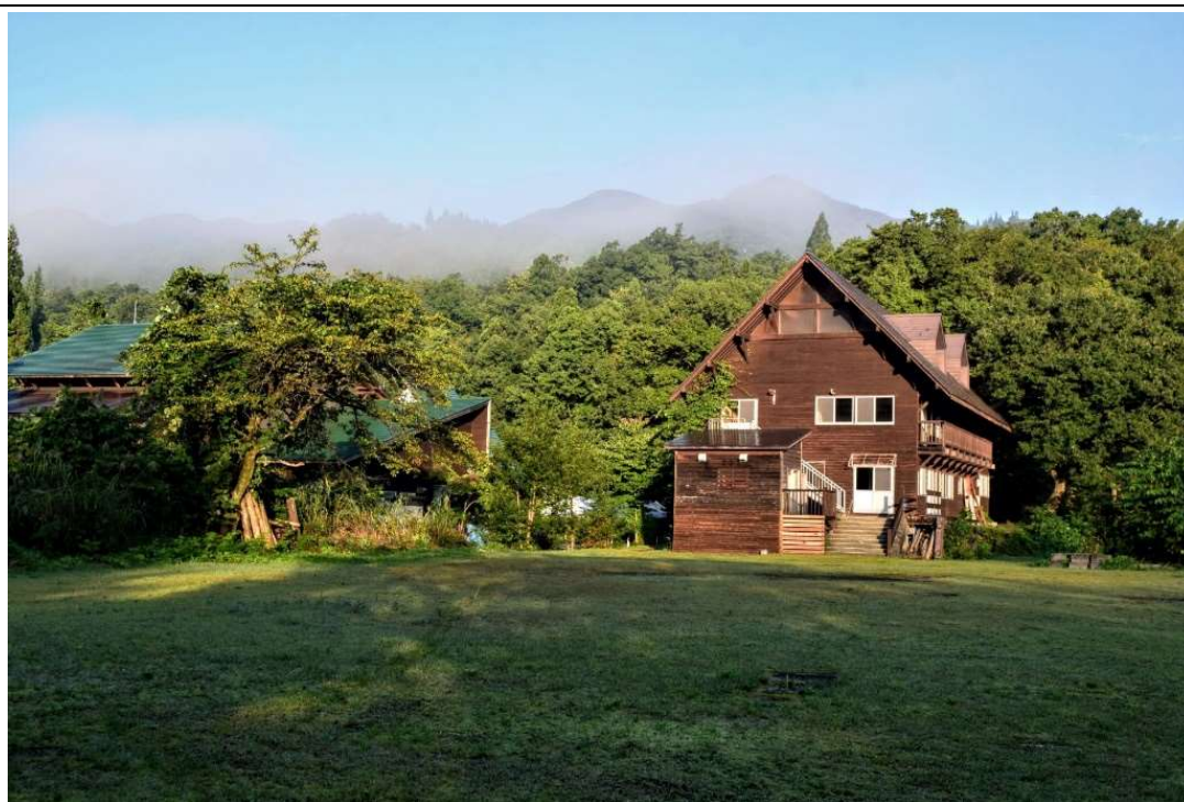
m DSC_1494 薄霧(もや)かかる与平の頭を背景に森林科学館&グリーンハウス R04.10.01AM0634.JPG