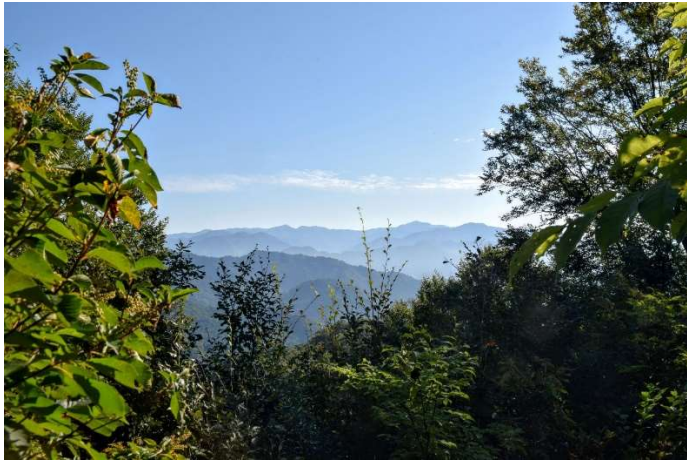
m DSC_1508 標高点（いくらの高さ？）先から見る展望 R04.10.01AM0759.JPG