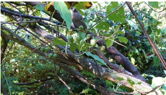
m DSC_1592 サルナシ根っ子の大杉への径 R04.10.01AM1152.JPG