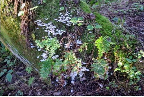
m DSC_1495 今は食べられなくなったスギモタセ R04.10.01AM0705.JPG