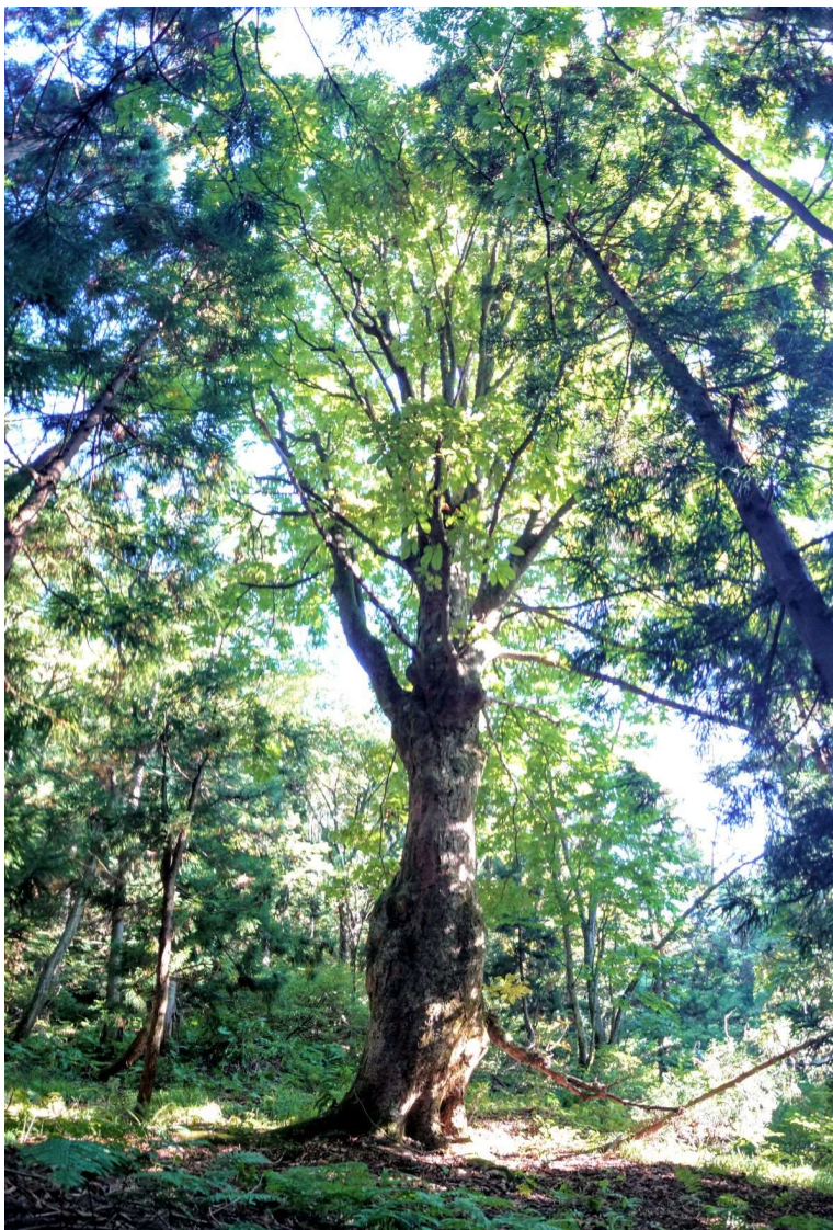
m DSC_1579 トチノキ大木 panorama R04.10.01AM0730.JPG